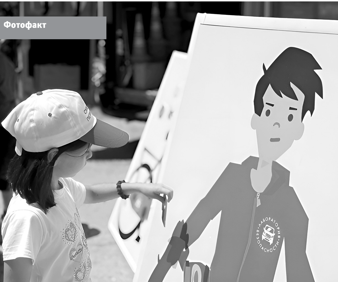
Сотрудники Госавтоинспекции МО МВД России «Хабезский» совместно с передвижным комплексом по безопасности дорожного движения «Лаборатория безопасности» провели для ребят из загородного детского оздоровительного лагеря «Беслан» профилактическое занятие, направленное на снижение детского дорожно-транспортного травматизма. Обучение проходило в интерактивной игровой форме, что позволило детям не только запомнить основные правила, но и сразу применить их на практике. Сотрудники «Лаборатории безопасности» организовали серию игровых заданий, охватывающих широкий спектр тем: от навыков безопасного перехода дороги до безопасной езды на двухколесном транспорте и понимания значения дорожных знаков.