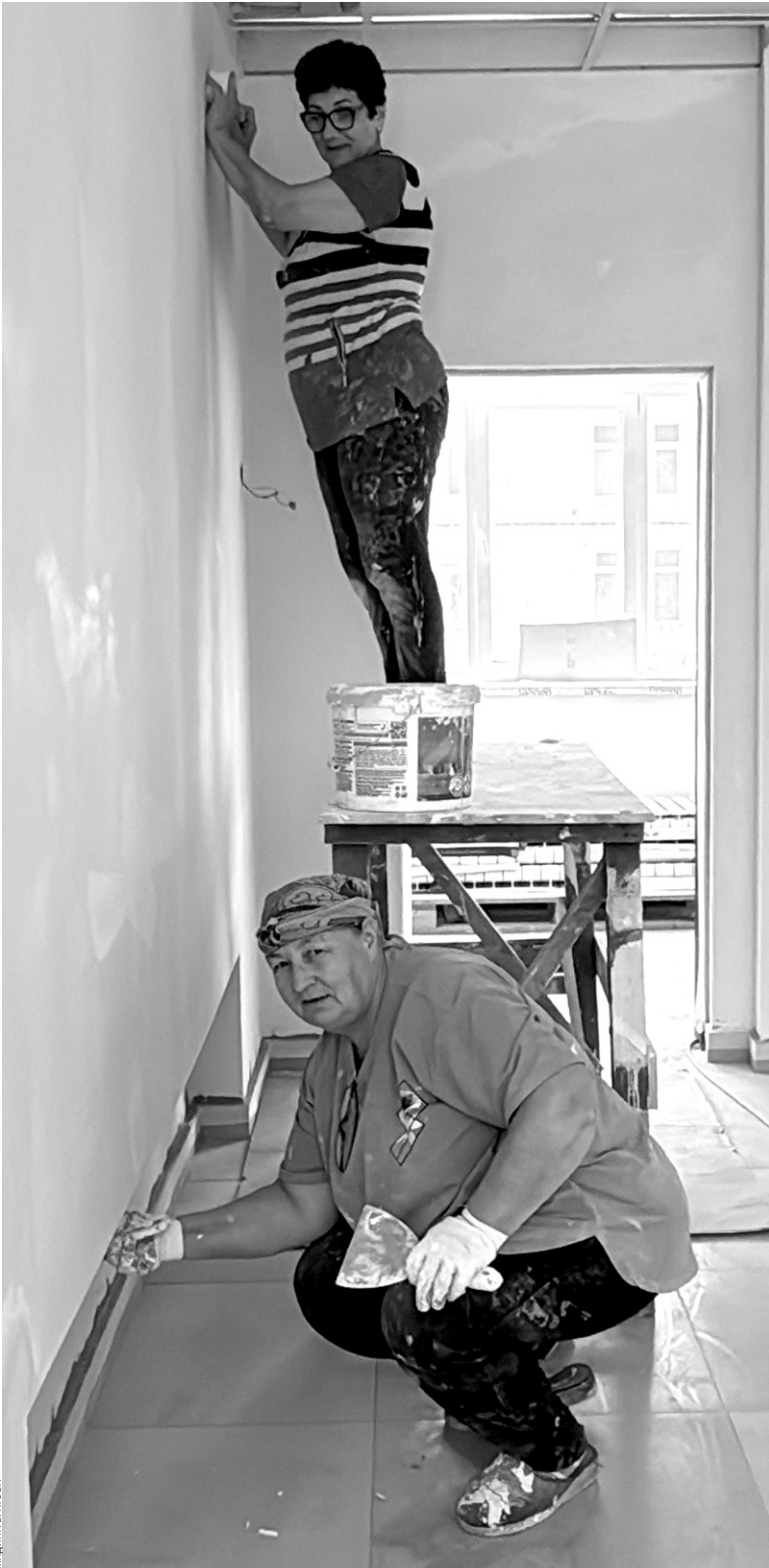
Рабочие делают последние штрихи