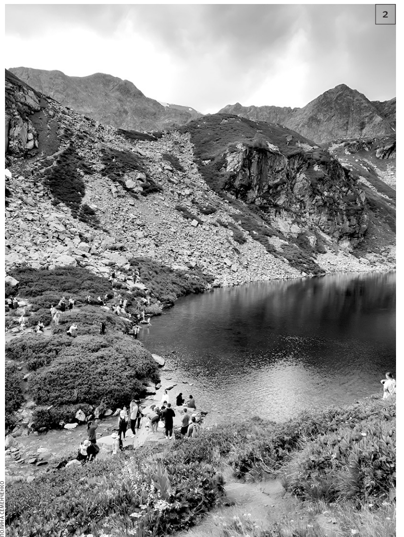
1. Наша семья на фоне озера в окружении гор 2. Некоторые смельчаки рискнули искупаться в природном водоеме

Дуккинские (Аркасарские) озера в Архызе — россыпь из нескольких горных озер на высоте 2400–2600 метров над уровнем моря. Три самых крупных носят названия: Рыбка, Аркасарское и Сказка Кавказа. Вместе с Семицветным и Софийскими озерами Дуккинские являются одной из самых популярных и посещаемых локаций Архыза.