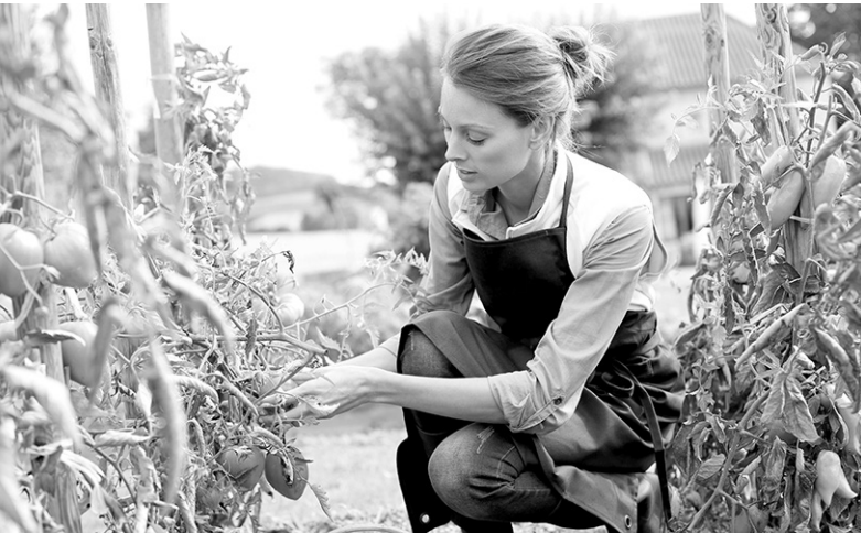
Важно не только вырастить, но и сохранить урожай

КСТАТИ, во время сбора урожая не оставляйте подгнившие плоды на грядках или в междурядьях, а падалицу под деревьями. Большинство некачественных плодов поражены болезнями или вредителями, поэтому лучше их просто уничтожить, чтобы они не стали разносчиками инфекции.